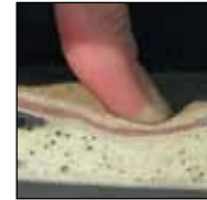
HAIX® MSL System