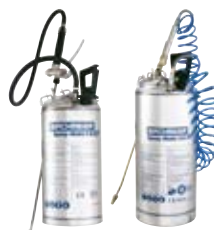
Spray-Matic 5 S / 10 S