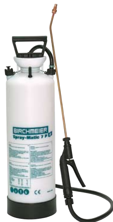
Spray-Matic 7 P

Für ein konstantes Ausbringen von Chemikalien und anderen Sprühmitteln: