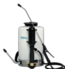
Spray-Matic 10 B